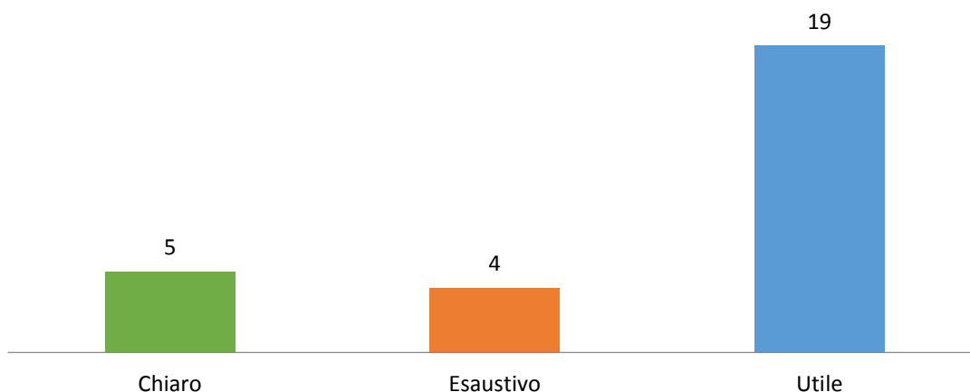
Figura 3: Intervento dei relatori

Per 19 dei 28 rispondenti (il 68%) l'intervento dei relatori è stato utile, per 5 chiaro e per 4 esaustivo; tra di essi c'è stato chi ha sottolineato la padronanza dei relatori nell'espone i temi dell' SRI e l'efficacia dei loro interventi 2 .